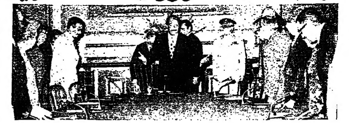
الرئيس السادات لدى اجتماعه أمس الأول بالجيش الاعلى للصحافة